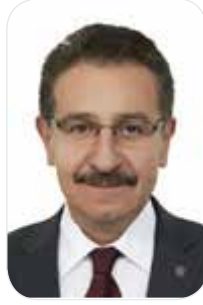
İsmail KUNDURACI Meclis Başkanı